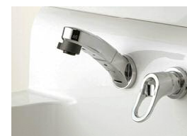
壁出し水栓 水栓の根元は、水も汚れも たまりにくく、衛生的でお掃 除もラクラクです。