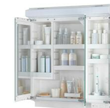
さまざまな工夫で 充実の収納機能。