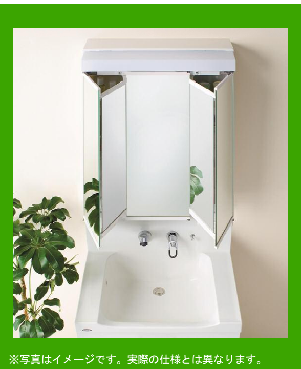
※写真はイメージです。実際の仕様とは異なります。