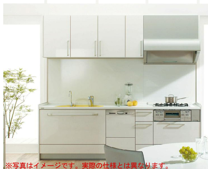
※写真はイメージです。実際の仕様とは異なります。