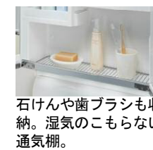
石けんや歯ブラシも収 納。湿気のこもらない 通気棚。