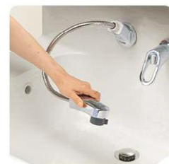
使いやすい ハンドシャワー水栓