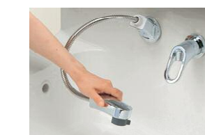
ハンドシャワー水栓 ホースを引き出せば、ハン ドシャワーになり、シャンプ ーやお掃除にも大活躍。