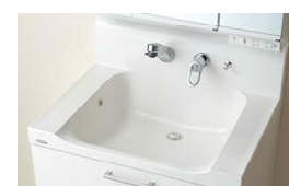
ハイバックガード カビやヌメリの原因となる 汚れもたまりにくく、毎日 のお手入れを簡単にします。