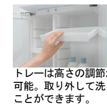
トレーは高さの調節が 可能。取り外して洗う ことができます。