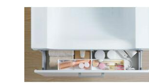
メイクやヘア小物などをサッと 出し入れできる2つの小物ポケット。