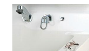
仮置きスペース 小物などを濡らさずに置け ます。