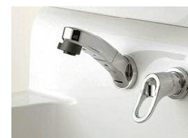
壁出し水栓 水栓の根元は、水も汚れも たまりにくく、衛生的でお掃 除もラクラクです。