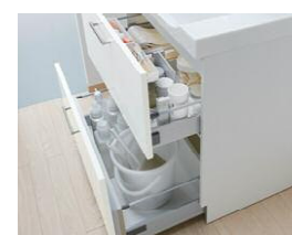
オールスライドタイプ 下段のケコミ部分も収納ス ペースに活用でき、背の高 い物もしっかり納まります。