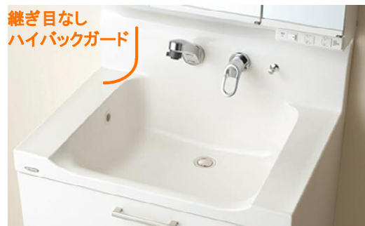
継ぎ目なし ハイバックガード