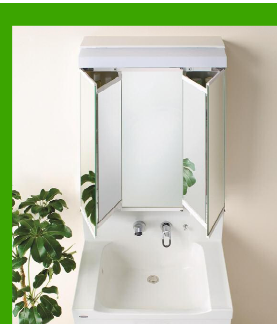
※写真はイメージです。実際の仕様とは異なります。